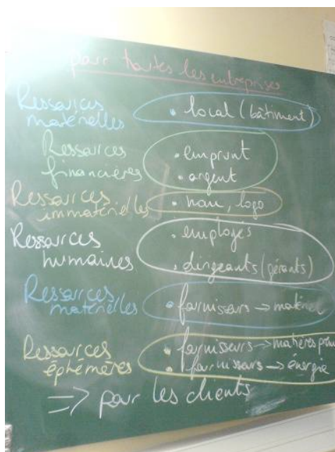
Exemple de tableau 2, réalisé avec la « classe-test »

↳ Trace écrite = tableau des ressources classées en familles réalisé au tableau par un échange entre la classe et le professeur puis recopié dans le cahier-élève.