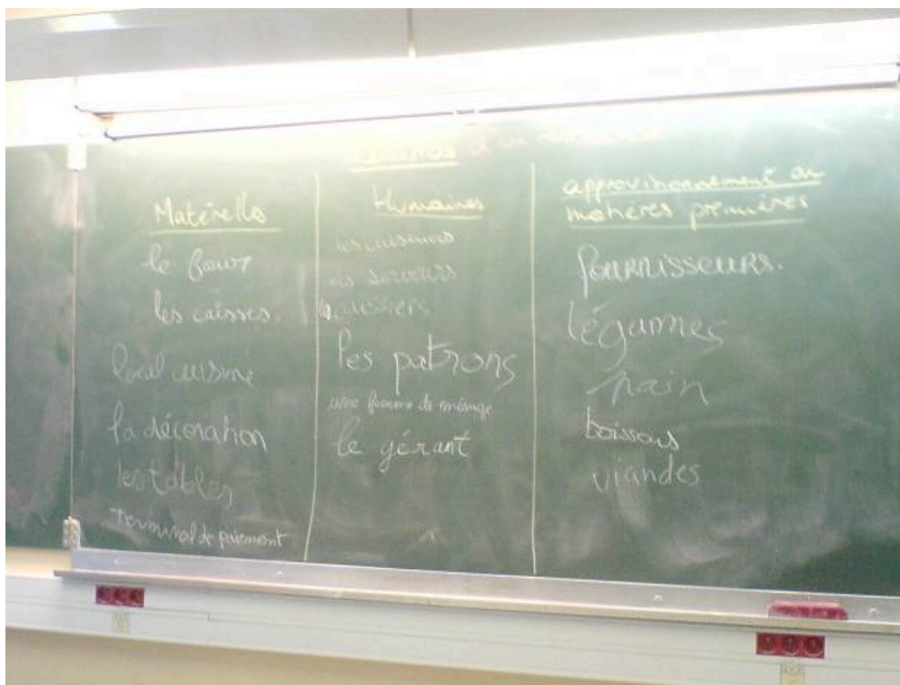
Exemple de tableau 1, réalisé avec la « classe-test »

Rassembler les éléments proposés par les élèves par catégories et les nommer. Il est important de faire émerger ces catégories du débat introduit dans la classe pour que les élèves s'approprient ce nouveau savoir.